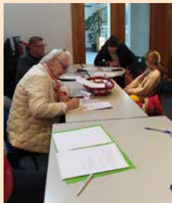
Tout le monde fut très studieux lors de l'atelier d'écriture du 14 janvier 2022.

Pour participer à l'un des ateliers, pensez à vous inscrire : biblio.berstett@gmail.com