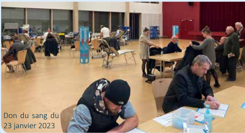
Don du sang du 23 janvier 2023