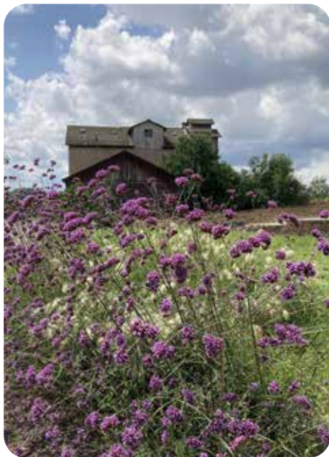
La houblonnière de Rumersheim