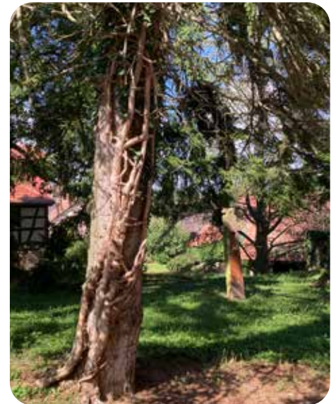
Une nature romantique à Reitwiller