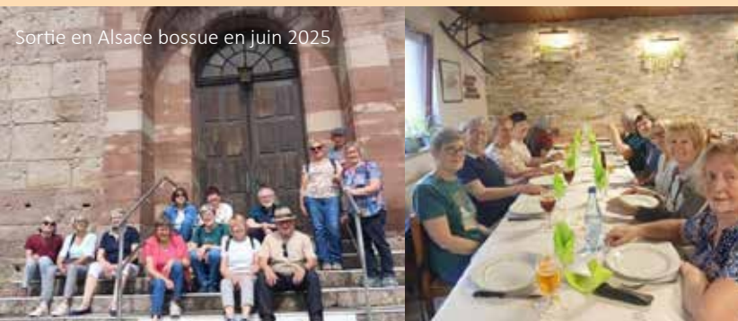
Sortie en Alsace bossue en juin 2025

Les dates et thèmes pour la période janvier-juin 2026 seront annoncés dans une prochaine édition du Dorfblattel, après fixation du calendrier d'occupation des salles. Quelques sorties en covoiturage seront également proposées. Elles sont toujours appréciées.