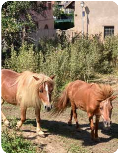
Éco pâturage à Reitwiller